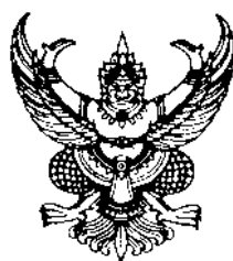
ครุฑ ขนาด 3 เซนติเมตร